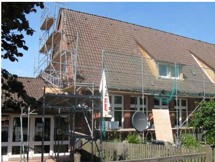
Energetische Sanierung der Grundschule Betzendorf

Veränderungen gab es auch im Bereich der Wasserversorgung in Rolfsen . Der letzte lokale Wasserbeschaffungsverband (WBV) im Landkreis stellte im Herbst die eigene Förderung von Trinkwasser ein. Der WBV Rolfsen hat einen Kooperationsvertrag mit dem regionalen Wasserwirtschaftsunternehmen PURENA abgeschlossen. Künftig wird die PURENA die rund 400 Einwohner in Rolfsen mit 30.000 Kubikmetern Trinkwasser pro Jahr aus dem Wasserwerk Amelinghausen versorgen. Der Rolfsener Verband fördert jetzt zwar kein Wasser mehr, bleibt aber bestehen und konzentriert sich künftig auf die Unterhaltung des Verteilernetzes im Ort.