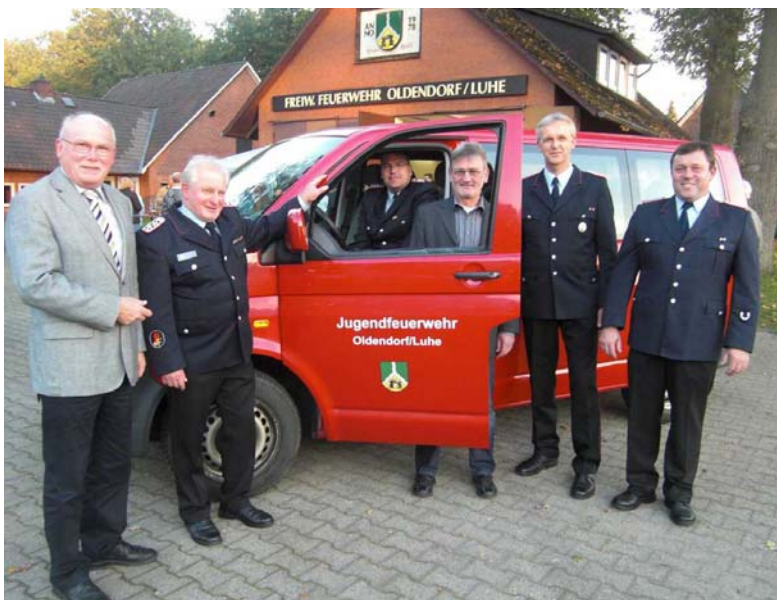
Übergabe des Kleinbusses an die Jugendfeuerwehr Oldendorf/Luhe

Im Bereich der touristischen Infrastruktur wurden auch viele Bausteine auf den Weg gebracht. Auf der einen Seite wurden neue Schilder des Naturparkes auch bei uns in der Samtgemeinde Amelinghausen aufgestellt. Wir begrüßen alle Gäste und Durchreisende in der Lüneburger Heide und tragen damit auch zur regionalen Identität bei. Zusätzlich zu den Begrüßungsschildern des Naturparkes haben wir drei eigene Ortsbegrüßungsschilder in Amelinghausen aufgestellt. In Kombination mit den Veranstaltungshinweisen setzen wir auch hier den Weg zur Erhöhung der Wiedererkennung mittels unseres Corporate Design fort. Im Rahmen des Beschilderungskonzeptes wurde ebenfalls mit der Gestaltung von öffentlichen Plätzen begonnen. Seit Ende des Jahres wird der Rastplatz an der Kronsbergheide neu gestaltet. Die komplette Fertigstellung wird im Frühjahr 2011 sein. Bis dahin soll sich die Gestaltung auch auf weitere Plätze ausdehnen. Vorbereitet wurde ebenfalls die Neubeschilderung der Wanderwege . Diese soll nach Abstimmung mit den ehrenamtlichen Wanderwegebetreuern alsbald abschnittsweise umgesetzt werden.