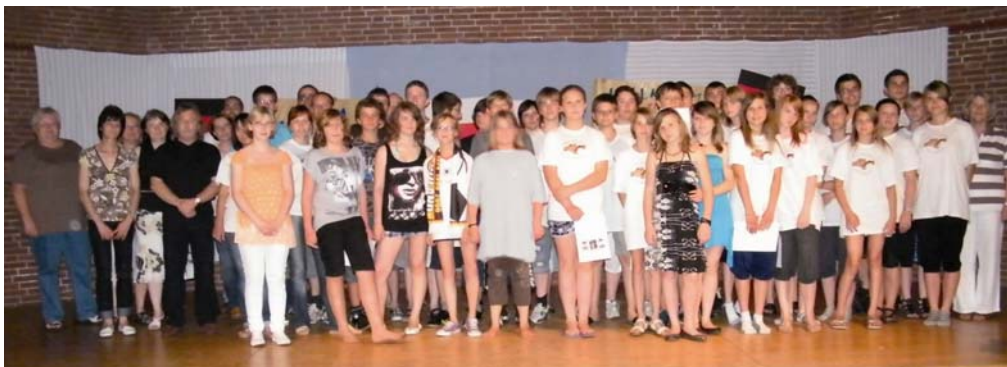
Jugendfreizeit Amelinghausen/Wapno: Teilnehmer, Betreuer und ehren- amtliches Organisations- und Helferteam

Unsere Partnerschaft mit der polnischen Gemeinde Wapno wird sehr intensiv gepflegt. Eine Jugendfußballmannschaft des JFC Heidetal war im Frühjahr für fünf Tage in Wapno zu Gast. Die diesjährige Sommerjugendfreizeit wurde in Amelinghausen ausgerichtet. Die Jugendfeuerwehr aus Wapno nahm am diesjährigen Gemeindefeuerwehrtag in Amelinghausen teil. Drei Hilfs- und Unterstützungstransporte wurden durchgeführt und im Oktober fand die diesjährige Partnerschaftsfahrt nach Wapno mit 25 Teilnehmern statt.