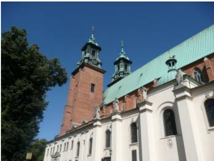
Dom in Gniezno