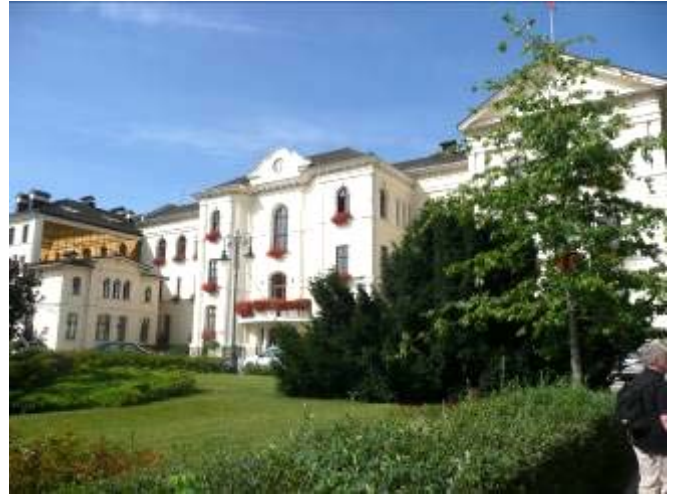
Regierungsgebäude in Bydgoszcz