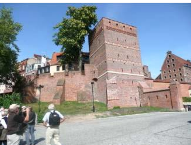
Bastei im Südwesten Toruns