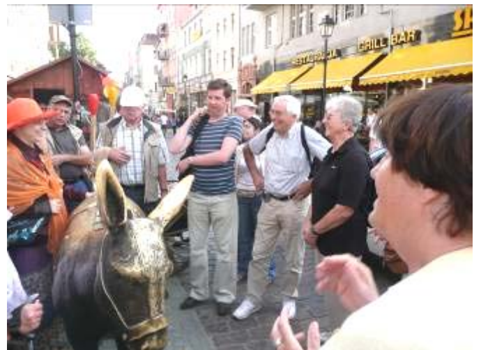
Führung in Torun