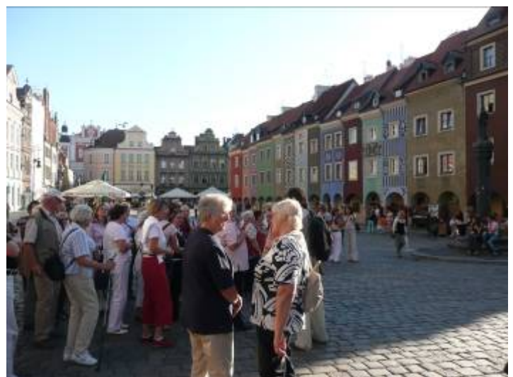
Auf dem "Alten Markt" in Poznan