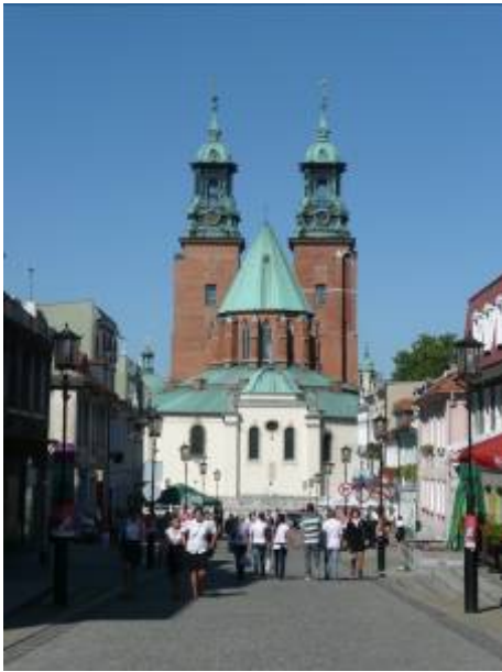
Dom von der Trumska in Gniezno