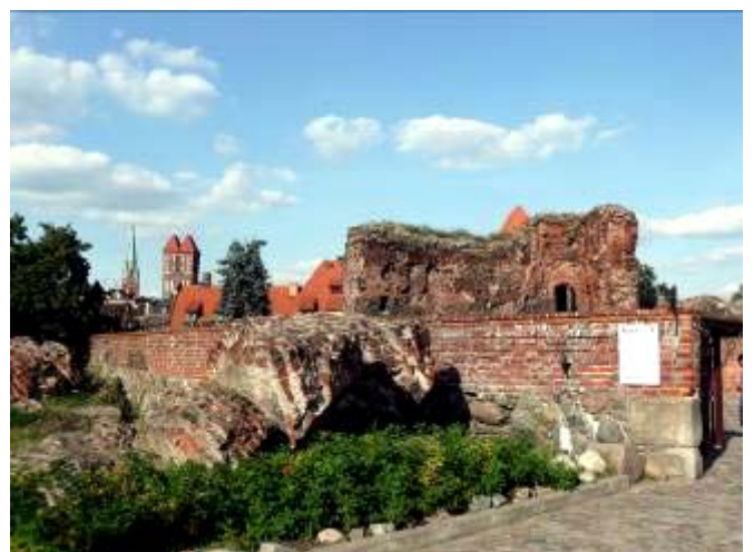
Burgruine mit Rathaus in Torun