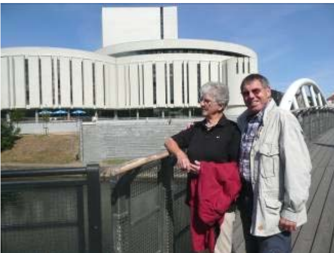
Vor der "Opera Nova" in Bydgoszcz