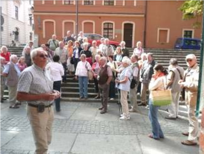
Vor der Domkirche in Bydgoszcz