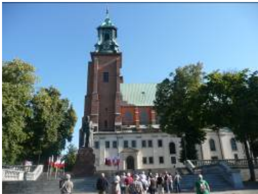
Dom in Gniezno