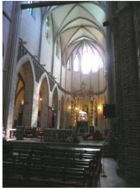
mittleres Kirchenschiff mit Altar