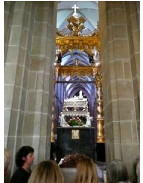
Altar im Dom Gniezno