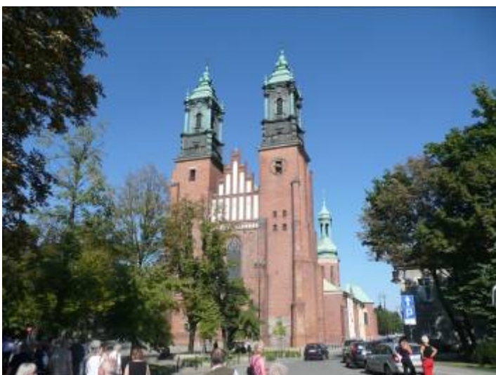
Dom in Poznan