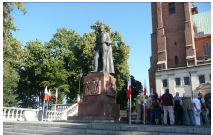
Auf dem Domplatz in Gniezno