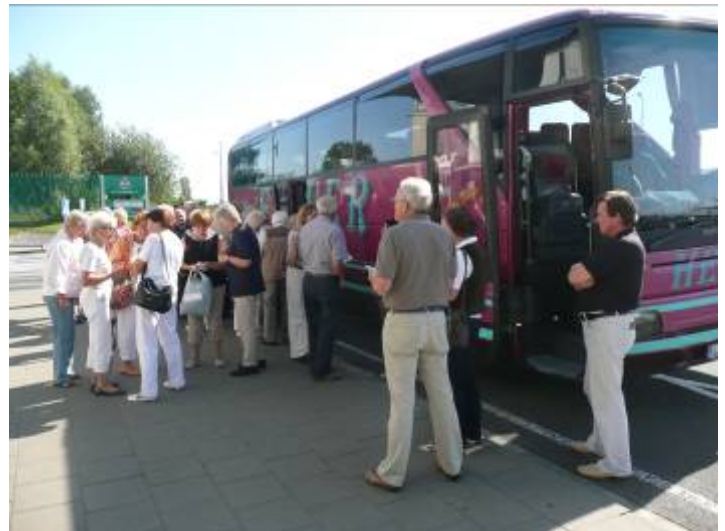
Pause vor Lech - Brauerei in Poznan